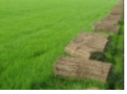
bursa rulo cim

BURDUR BURSA Å†ANAKKALE Å†ANKIRI Å†ORUM DENÄ°ZLÄ° DÄ°YARBAKIR DÄ°ZCE EDÄ°RNE ELAZIÅž ERZÄ°NCAN ERZURUM ESKÄ°ÅžEHÄ°R GAZÄ°ANTEP GÄ°RESUN GÄ°MÄ°ÅžHANE HAKKARÄ° HATAY İÄZDIR ISPARTA Ä°STANBUL Ä°ZMÄ°R KAHRAMANMARAÅž KARABÄ°K KARAMAN KARS KASTAMONU KAYSERÄ° KIRIKKALE KIRKLARELÄ° KIRÄ°ZHÄ°R KÄ°LÄ°S KOCAELÄ° KONYA KÄ°TAHYA MALATYA MANÄ°SA MARDÄ°N MERSÄ°N MUÄžLA MUÄž NEVÄ°ZHÄ°R NÄ°ÅžDE ORDU OSMANÄ°YE RÄ°ZE SAKARYA SAMSUN SÄ°Ä°RT SÄ°NOP SÄ°VAS ÅžANLI URFA TEKÄ°RDAÄž TOKAT TRABZON TUNCELÄ° UÄžAK VAN YALOVA YOZGAT ZONGULDAKRulo Åšim bursa Rulo cim bursa Rulo cim fiyat bursa Rulo cim fiyatlarÄ± bursa Rulo cim fiyat al bursa Rulo cim uygula bursa Rulo cim uygulama bursa Rulo cim uygulamasÄ± bursa Rulo cim al bursa Rulo cim dÄ¼zenleme bursa Rulo cim peyzaj bursa Rulo cim firmasÄ± bursa Rulo cim firmalarÄ± bursa Rulo cim Å¼retimi bursa Rulo cim Å¼rÄ¼nleri bursa Rulo cim satÄ±ÄŸÄ± bursa Rulo cim sipariÅŸ bursa Rulo cim teklif bursa Rulo cim teklif al bursa Rulo cim satÄ±n al bursa Rulo cim sipariÅŸi bursa Rulo cim serme bursa Rulo cim kesme bursa Rulo cim satÄ±s bursa Rulo cim satÄ±ÄŸ bursa Rulo cim firma bursa Rulo cim firmasÄ± bursa Rulo cim firmalarÄ± bursa Rulo cim Å¼retim Rulo cim pazarÄ± Rulo cim sermesi Rulo cim dÄ¼zenlemesi Rulo cim temini Rulo cim sanayii Rulo cim tohumu Rulo cim ÅšeÄŸitleri Rulo cim sipariÅŸ et tel: 05353583714 tesisimiz 200 dÄ¶nÄ¼mdÄ¼rÄ¼retimini ve uygulamasÄ±nÄ± yapan firmadan rulo Åšim