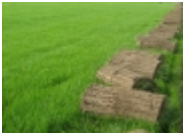
bursa rulo cim

Bursa rulo cim bakis hazir rulo cim uretimi ve uygulamasini yapan firmadan [Aşim Detay...]